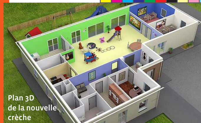
Plan 3D de la nouvelle crèche

De son côté, l'association Grains de Soleil s'est engagée à entretenir le bien durant le bail, à contracter l'emprunt nécessaire, à veiller à l'équilibre budgétaire (construction et gestion de la structure) et enfin, à gérer avec dynamisme ce nouvel outil avec, par exemple, de belles perspectives de collaboration avec l'école «Pierre Brossolette».