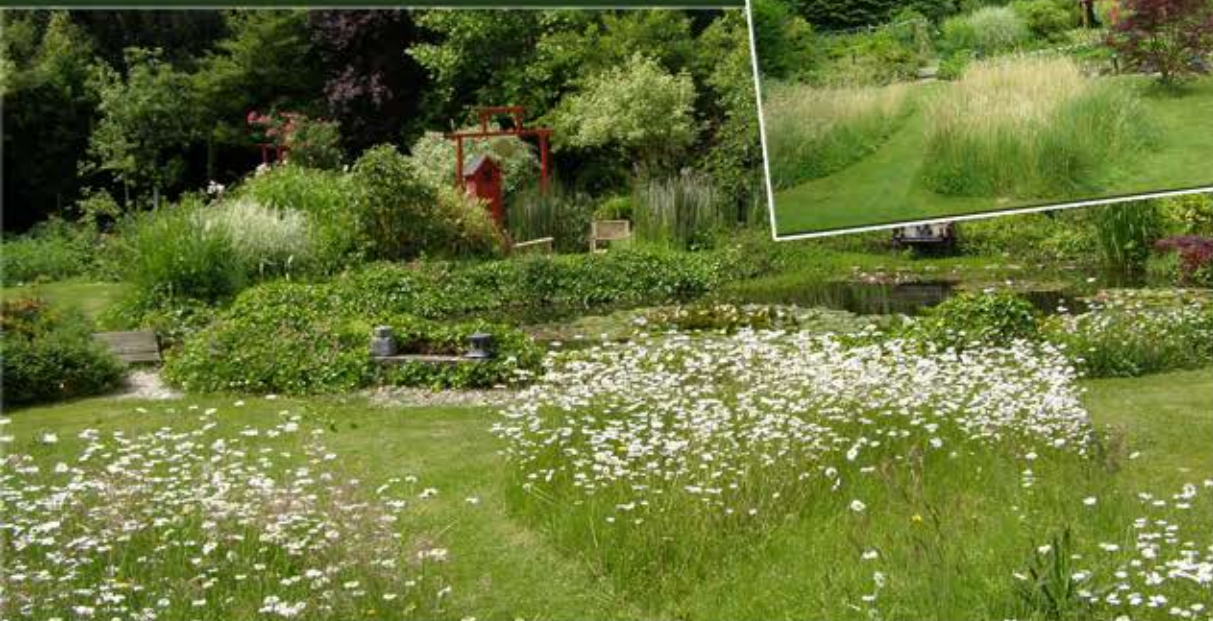
LES HERBES FOLLES : fleurs, herbes sauvages, crapauds, abeilles, bourdons, papillons et toutes sortes d'insectes.

LES VERGERS : celui-ci est bordé par une haie champêtre* diversifiée et mellifère