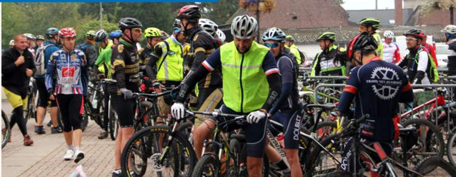
PLUS DE 1 400 PARTICIPANTS POUR LA RANDONNÉE DES RENARDS DES SABLES

Vététistes, cyclistes et randonneurs de tous niveaux sont partis de Flines pour découvrir le cadre verdoyant des vallées de la Scarpe et de la Sensée. Une occasion exceptionnelle d'explorer les terroirs de Lallaing, Rieulay, Pecquencourt et Sin-le-Noble.