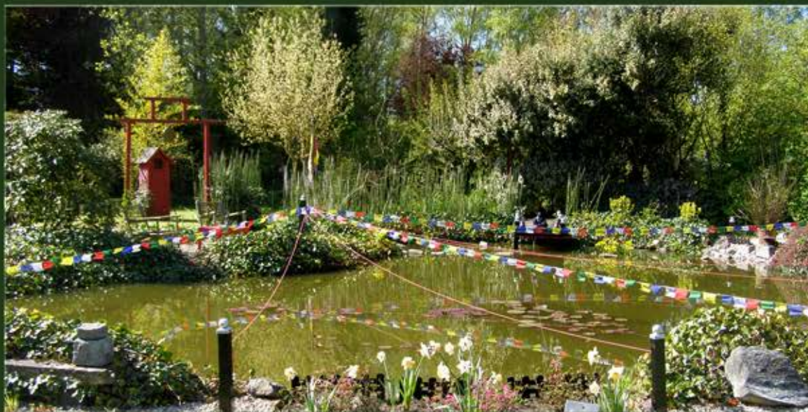
LA MARE : véritable réservoir de biodiversité, poissons, grenouilles, salamandres, tritons, libellules, martin-pêcheur, héron...