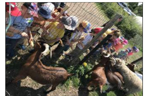
Visite de la ferme des Vanneaux à Roost-Warendin pour les G1/G2/G3/G4