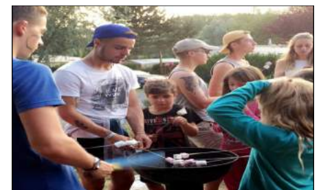
Séjour au camping des Evoiches à Marchiennes pour le G7/G8/G9