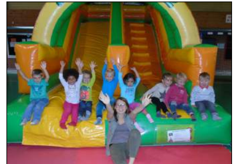
Journée exceptionnelle « structures gonflables » du mercredi 12 juillet