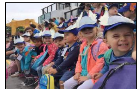
Sortie au parc Astérix pour tout le monde !!