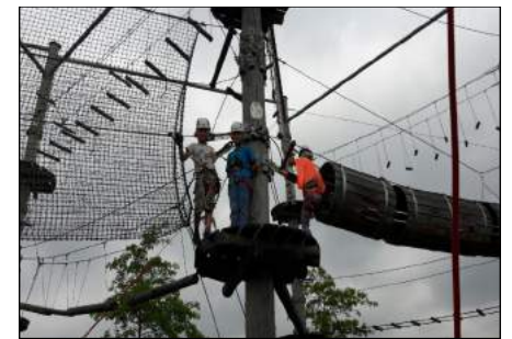
Accrobranche pour le G5/G6 au parc Jacques Vernier à Douai