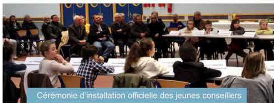
Cérémonie d'installation officielle des jeunes conseillers