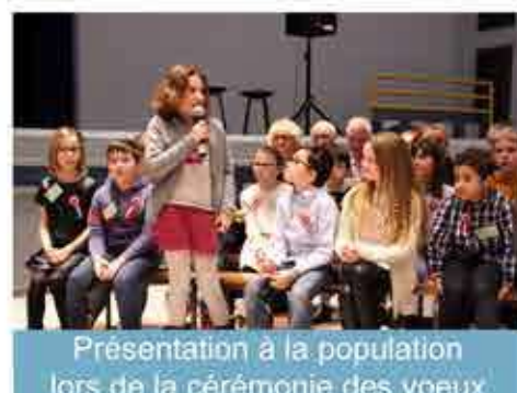
Présentation à la population lors de la cérémonie des vœux.

Le Conseil Municipal des Enfants est un lieu de discussion, de réflexion, de proposition et d'action pour les jeunes Flinois.