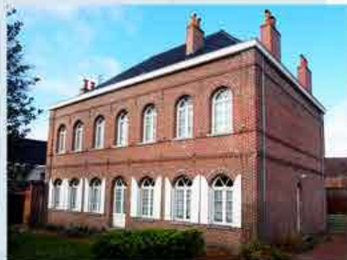
Le presbytère, dans le périmètre de l'église St Michel.