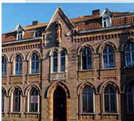
Dés 2019, 57 logements seront construits sur le site de l'ancien couvent.

La réhabilitation du site du couvent. Le choix du promoteur s'est fait dans le cadre du contrat de mixité sociale, par l'Etat, l'Etablissement Public Foncier, l'association régionale HLM, la CAD et la commune.