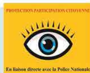
La visualisation de ce panneau est dissuasive.

Visite de contrôle des consignes de sécurité dans toutes les écoles