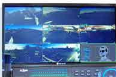
La video-surveillance, un investissement efficace

2018 verra la signature du protocole participation citoyenne entre le Maire, le sous-prefet et le commissaire divisionnaire de police de Douai, en présence du Procureur de la République.