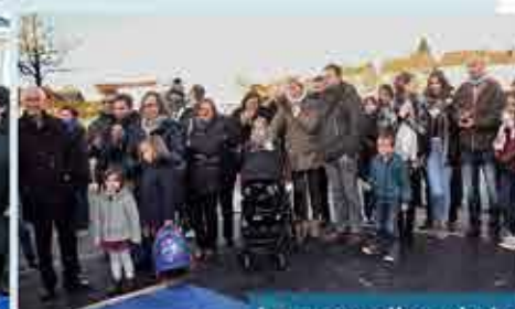
La nouvelle crèche des Mini-Pouss