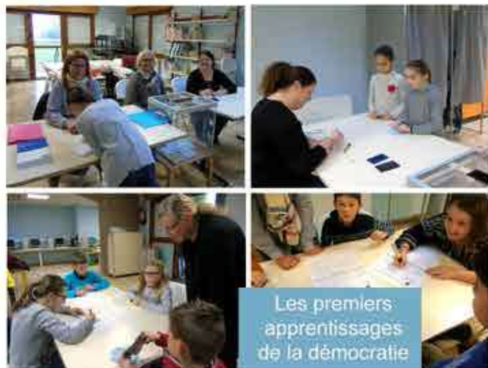
Les premiers apprentissages de la démocratie

Elles se sont déroulées comme des élections classiques. Les candidats se sont fait connaître, ils ont mené leur campagne avant d'être soumis au verdict des urnes.