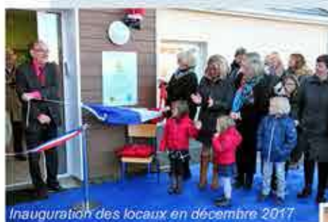
Inauguration des locaux en décembre 2017