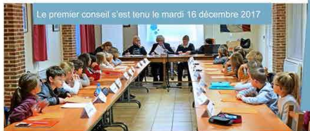
Le premier conseil s'est tenu le mardi 16 décembre 2017

Leur mission est de collecter les idées ou les souhaits de leurs camarades, de travailler sur des projets pour améliorer la vie des Flinois et de participer à la vie communale.