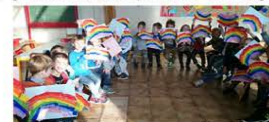
Fabrique ton arc-en-ciel

Lors de la « Journée spéciale licorne », les plus jeunes ont développé leur motricité fine grâce à la manipulation de l'argile.