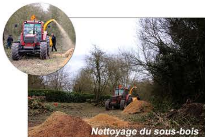
Nettoyage du sous-bois

Voici quelques-uns des chantiers sur lesquels ils ont travaillé dernièrement :