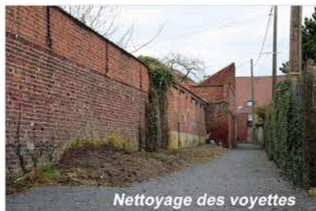
Nettoyage des voyettes

Ces interventions spécifiques nécessitent la location de matériel adapté: nacelle pour atteindre les plus hautes branches des arbres à élaguer ou mini-pelleuse pour le nettoyage de la voyette des Marequez par exemple.