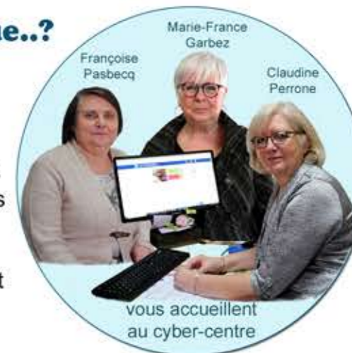
vous accueillent au cyber-centre

Pour toutes les personnes qui n'ont pas d'ordinateur ou d'accès internet, le CCAS dispose maintenant d'un cyber-centre. Vous pouvez vous y rendre pour effectuer toutes vos démarches administratives (Impôts, recherche d'emploi, caisse d'allocations familiales, caisse primaire d'assurance maladie...). Et si vous ne vous sentez pas à l'aide avec l'informatique, pas de problème, une équipe de bénévoles vous y accueillera et vous guidera dans vos démarches.