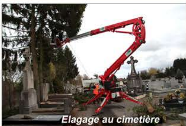
Elagage au cimetière

Ces interventions spécifiques nécessitent la location de matériel adapté: nacelle pour atteindre les plus hautes branches des arbres à élaguer ou mini-pelleuse pour le nettoyage de la voyette des Marequez par exemple.