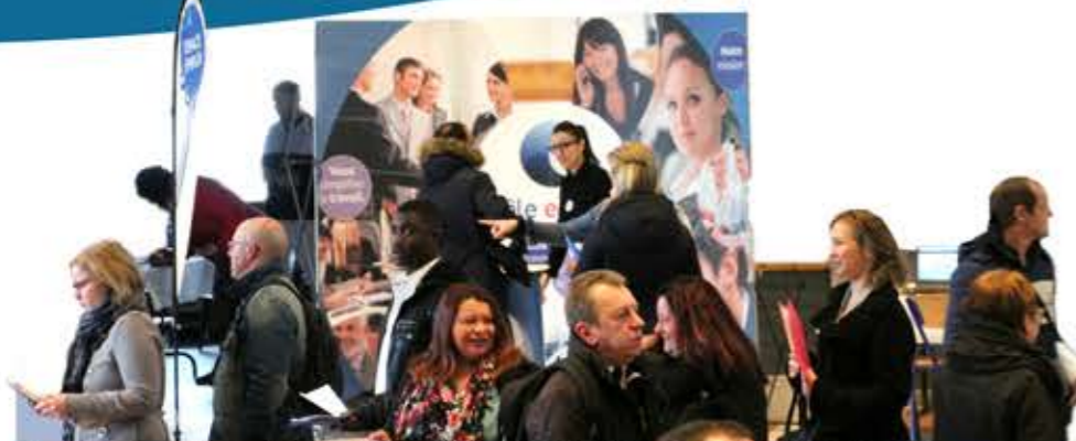
Tous les employeurs présents avaient des offres à proposer. Les candidats ont pu postuler en direct.

Parmi les recruteurs, soulignons la présence de l'entreprise flinoise SOGEM qui recherchait des soudeurs et des tuyauteurs.