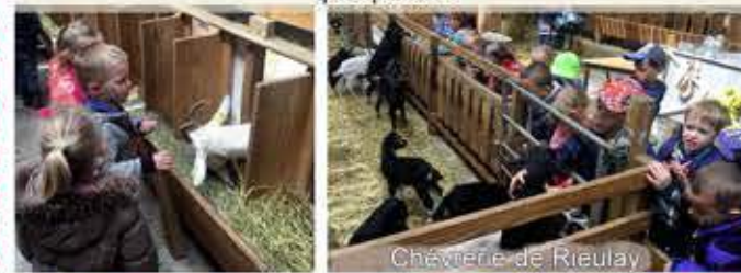
Chèvrerie de Rieulay