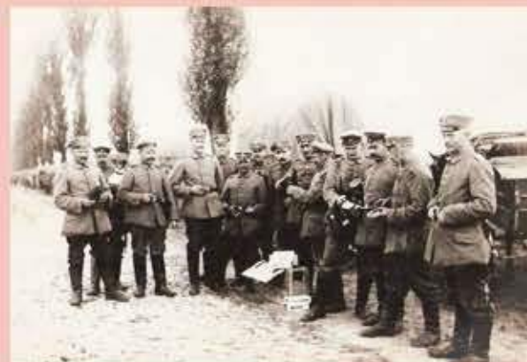
Soldats allemands sur le «Pavé d'Orchies»

Flines au Fil de son Histoire (FFH) prépare une exposition pour le Centenaire de la Grande Guerre : «50 mois d'occupation par les Allemands à Flines» les vendredi 9, samedi 10 et dimanche 11 novembre. L'association recherche tout document, objet, archive, photo, correspondance... pour illustrer la vie des Flinois en pays occupé, mais également sur les Flinois envoyés au front ou faits prisonniers en Allemagne. Site : flinesaufildesonhistoire.fr Contacts : monique.heddebaut@gmail.com françoise.vanhove@bbox.fr 03 27 91 63 51