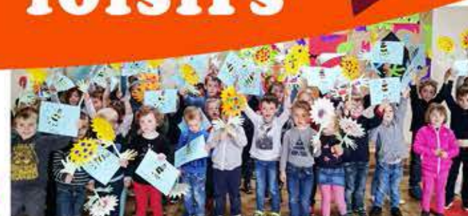
Bzzz... on bourdonne d'idées et d'activités !