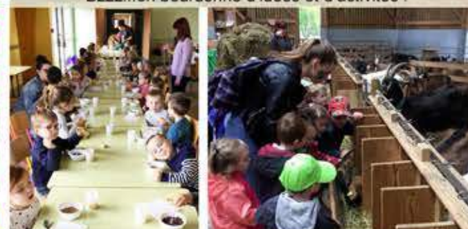
Humm... bien manger et découvrir les producteurs locaux, quel plaisir !