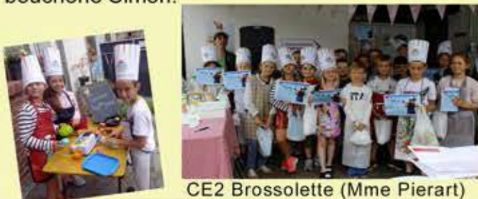
CE2 Brossolette (Mme Pierart)

Suite au concours de dessins organisé lors des Andouillades Flinoises, les classes victorieuses ont eu droit à un « atelier andouille » à la boucherie Simon.